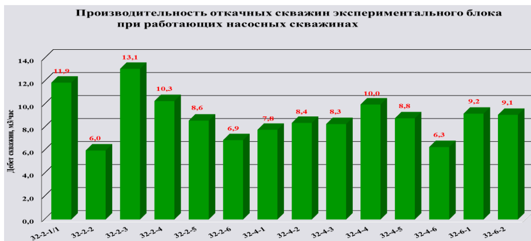
Рисунок 3 Производительность откачных скважин экспериментального блока при работающих насосных скважинах

Как видно из графиков, при отключенных насосных скважинах из 14 откачных скважин дебит равен нулю, а в остальных скважинах дебит изменяется от 0,8 м³ /час до 3,3 м³ /час. При работающих «насосных скважинах» наблюдается равномерный дебит всех скважин, дебит изменяется от 6,0 м³ /час до 13,1 м³ /час.